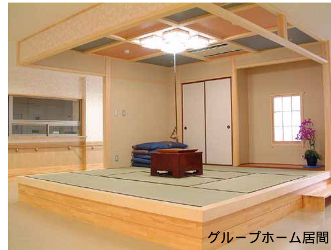
グループホーム居間